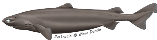
Portugese ijshaai Centroscymsus coelelepis Maximale lengte: 121cm