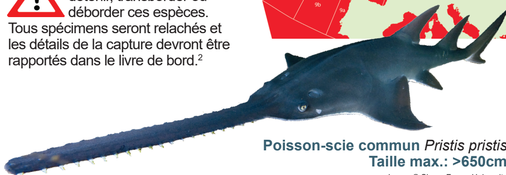
Poisson-scie commun Pristis pristis Taille max.: >650cm