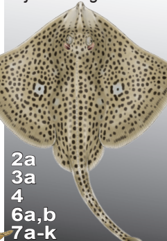
Raie douce [RJM] Raja montagui