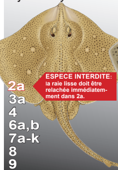
Raie lisse [RJH] Raja brachyura