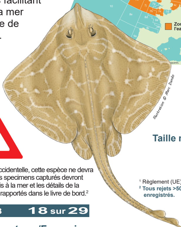
Illustration © Marc Dando