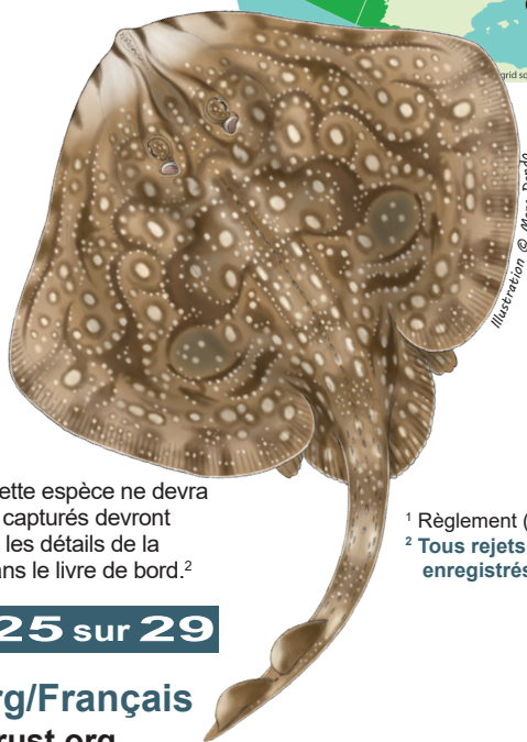
Illustration © Marc Dando