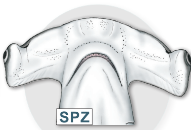
Requin-marteau commun Sphyrna zygaena

Large rostre sans encoche au centre de la tête.