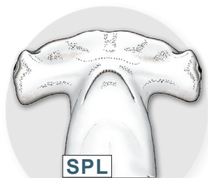
Requin-marteau halicorne Sphyrna lewini

Illustrations de requins-marteaux © Marc Dando