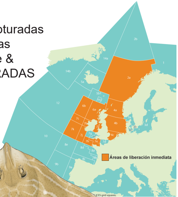
Ilustración © Marc Deniro

Los pescadores son alentados a garantizar la liberación rápida y segura de esta raya.