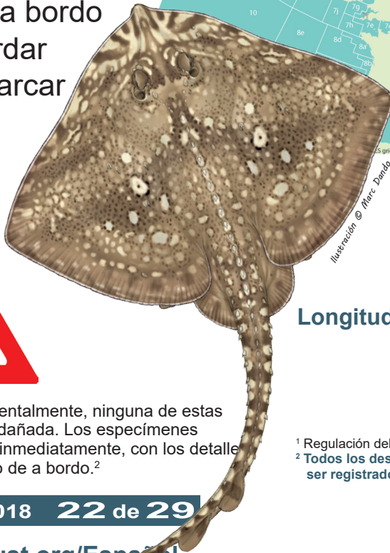
Ilustración © Marie Perle