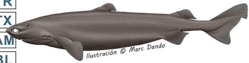
Pailona Centroscymnus coelolepis Longitud max.: 121cm