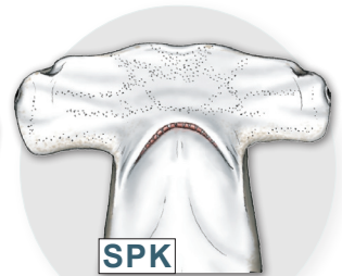
SPK Cornuda gigante Sphyrna mokarran

Cabeza amplia sin hendidura medial. LONGITUD MAX.: 400cm