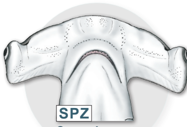
SPZ Cornuda cruz Sphyrna zygaena

Prominente hendidura en el centro de la cabeza; dos hendidura más a cada lado de la hendidura central. LONGITUD MAX.: 420cm